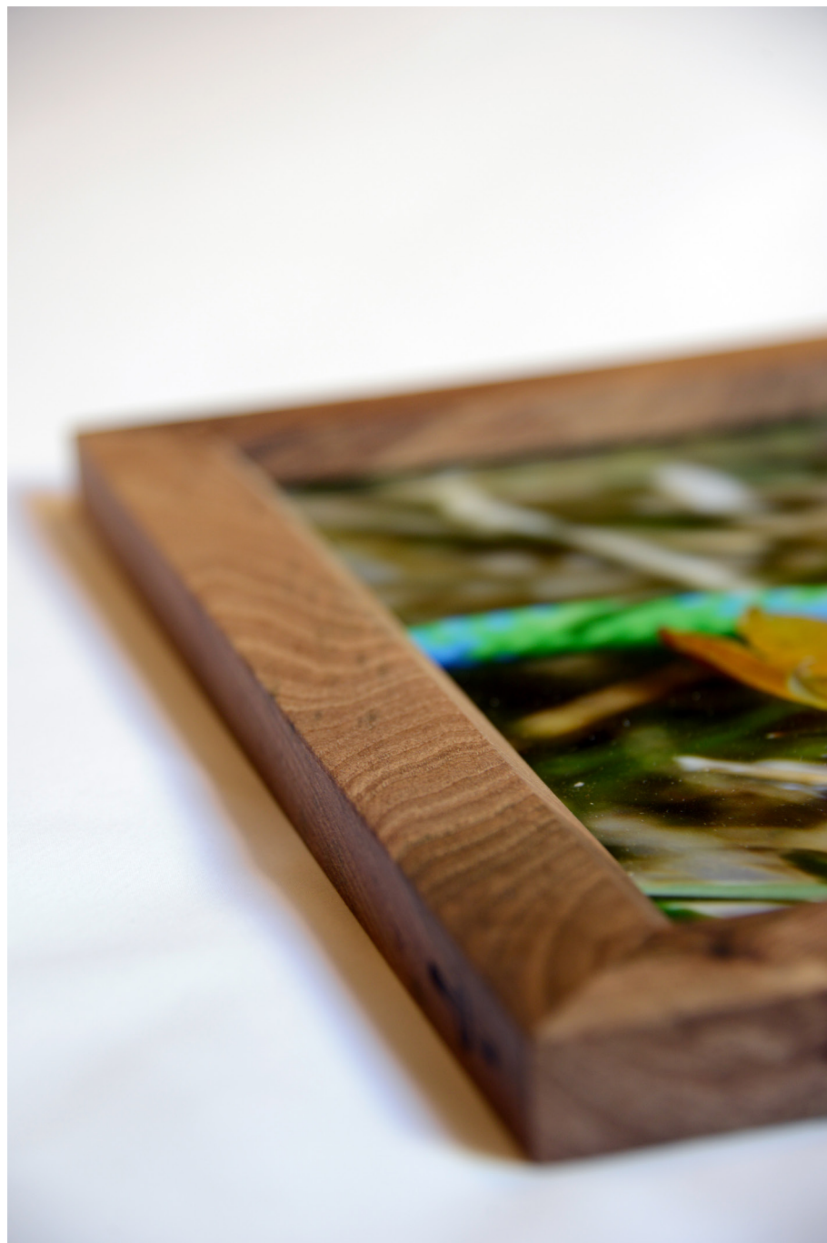
FOTO - cadres photos

2025 | collaboration avec Atelier Roulades - ébéniste créateur Frêne - Noyer